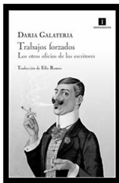
PORTADA DE TRABAJOS FORZADOS, LOS OTROS OFICIOS DE LOS ESCRITORES DE DARIA GALATERIA

dad, pero todos han plasmado en sus obras las experiencias que han ido acumulando sobre aquellos oficios más físicos, en su mayoría, que la escritura, fuesen más o menos aventureros. Llegando en algunos casos a preferirlos antes que tener la obligación de cumplir unos plazos de entrega. Así Thomas Eliot cambió la docencia, más prestigiosa, por la banca para después pasar al mundo editorial, Faber & Faber sería la primera editorial de poesía de Inglaterra. Su decisión fue fácil, enseñar le exigía una dedicación completa que agotaba sus fuerzas, no dejándole crear tras la jornada. Parece que acertó, pues recibiría el Nobel en 1948. E incluso en su trabajo como banquero se inspirarían algunos de sus poemas. Jack London, que llegaría a ser el escritor mejor pagado de su tiempo, fue entre otras cosas: transportador de maletas, fogonero, cazador de focas, contrabandista de ostras... trabajos físicos que después no le